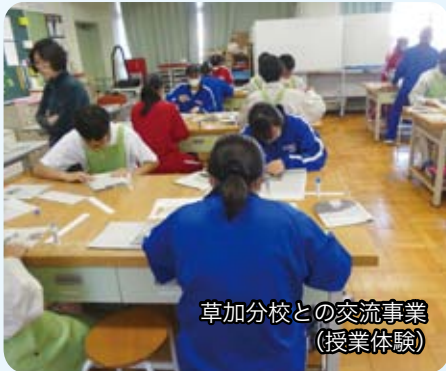
草加分校との交流事業 (授業体験)