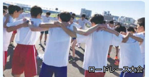
ロードレース大会