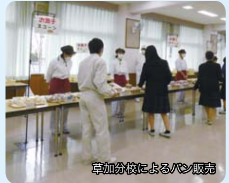
草加分校によるパン販売